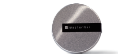
缶ケース (ロゴラベル付き)