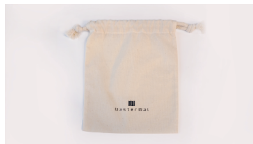
巾着袋 (ロゴプリント有り)